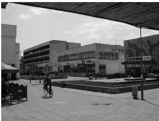
Fot. 6. Plac Konstytucji 3 Maja. Photo 6. "Konstytucja 3 Maja" Square.

Do rewitalizacji przeznaczono trzy obszary. Pierwszy obejmuje tereny najważniejsze dla miasta - jego centrum i pierwsze zabudowania przedwojennych osiedli pracowniczych, w większości tereny objęte strefą ochrony konserwatorskiej. Drugim obszarem są tereny zabudowy głównie z najwcześniejszych lat powojennych - osiedle w stylu socrealizmu. Jest to zabudowa wpisana w charakter miasta i w jego skali. Trzeci obszar to tereny oczyszczalni ścieków. W ramach tych obszarów wyznaczono kilka projektów do realizacji. Najważniejszym z nich jest Modernizacja Placu Konstytucji 3 Maja. Jest to plac obudowany zespołem budynków modernistycznych z lat siedemdziesiątych XX w. o funkcji handlowo-usługowej. Powinien on być wizytówką miasta, gdyż tu znajduje się największy hotel w mieście i wiele instytucji. Po rewitalizacji byłby to architektonicznie zaakcentowany rodzaj „ryнку” – forum miasta. Kolejne projekty to: modernizacja Alejki Spacerowej „Parku”, odbudowa Stadionu Sportowego, budowa pieszego przejścia podziemnego pod torami kolejowymi, modernizacja budynku Kasyna oraz zakup i modernizacja ciepłowni, modernizacja ogródka jordanowskiego (projekt zrealizowany), projekt modernizacji oczyszczalni ścieków.