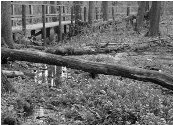
Fot. 3. Rezerwat Królewskie Źródła.

Photo 3. Nature Reserve "Krolewskie Zrodla" ("Royal Springs").