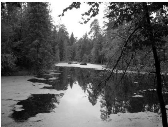
Fot. 4. Rezerwat Brzeźniczka.

Photo 3. Nature Reserve "Krolewskie Zrodla" ("Royal Springs").