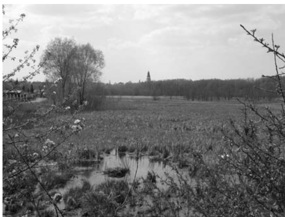
Fot. 5. Teren przeznaczony na odtworzenie Stawu Dolnego. W dali wieża kościoła Św. Barbary. Photo 5. The location of the future Lower Lake. In the background the tower of St. Barbara's Church.

Miejscowy plan zagospodarowania przestrzennego miasta Pionki został uchwalony w październiku 2003 r. Rysunek planu wykonano w skali 1:5000 – określono w nim przede wszystkim linie rozgraniczające i przeznaczenie terenów. Wyznaczono również obszary, dla których powinny zostać sporządzone plany miejscowe. Plan ten jest bardzo ogólny i w zasadzie utrzuca już istniejący układ przestrzenny z niewielkimi korektami. Ze względu na krajobraz ważne jest wyznaczenie do odbudowy Stawu Dolnego oraz przeznaczenie terenów wzdłuż Zagożdżonki na zielenie nieurządzoną, zachowując jej naturalny charakter.