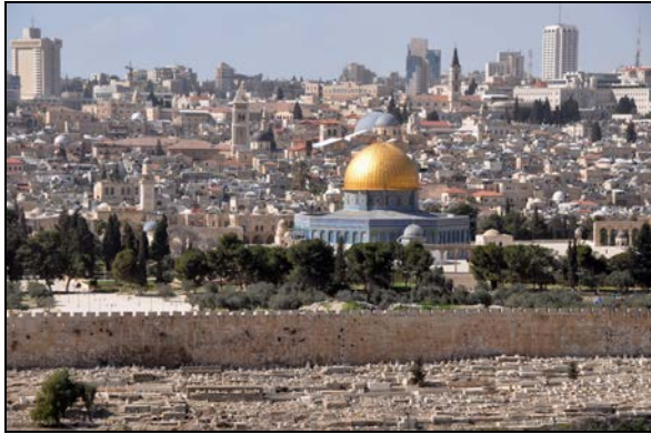
Fot. 7. Panorama Starego Miasta w Jerozolimie z Meczetem Al-Aqsa na pierwszym planie.

Photo 7. Panorama of the Old City in Jerusalem with the Al-Aqsa Mosque.