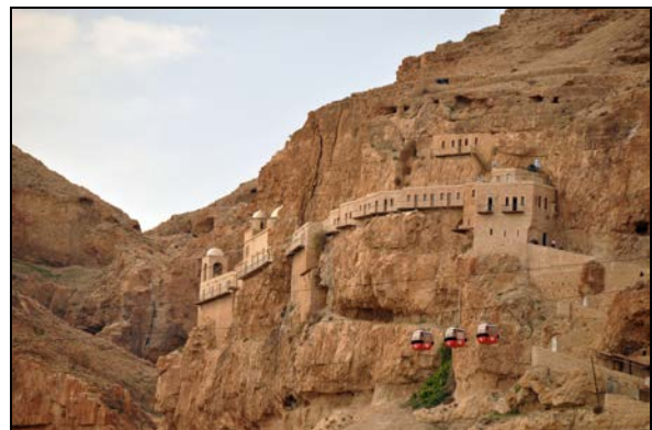
Fot. 3-4. Góra Kuszenia z prawosławnym klasztorem Czterdziestu Dni. Photo 3-4. Mount of Temptation and the Orthodox Monastery of Temptation.