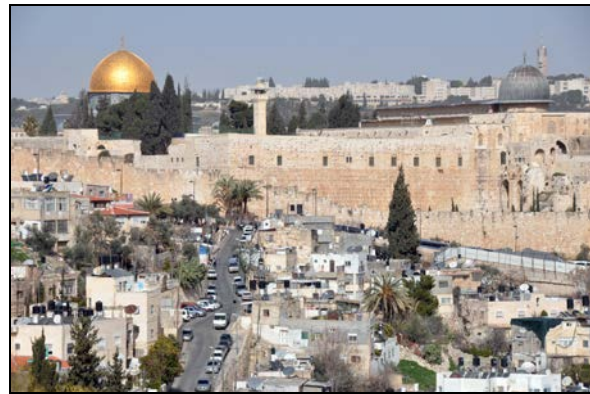
Fot. 10. Kopuły dwóch najważniejszych meczetów Jerozolimy na Wzgórzu Świątynnym.

Photo 9. Jews praying at the Wailing Wall.