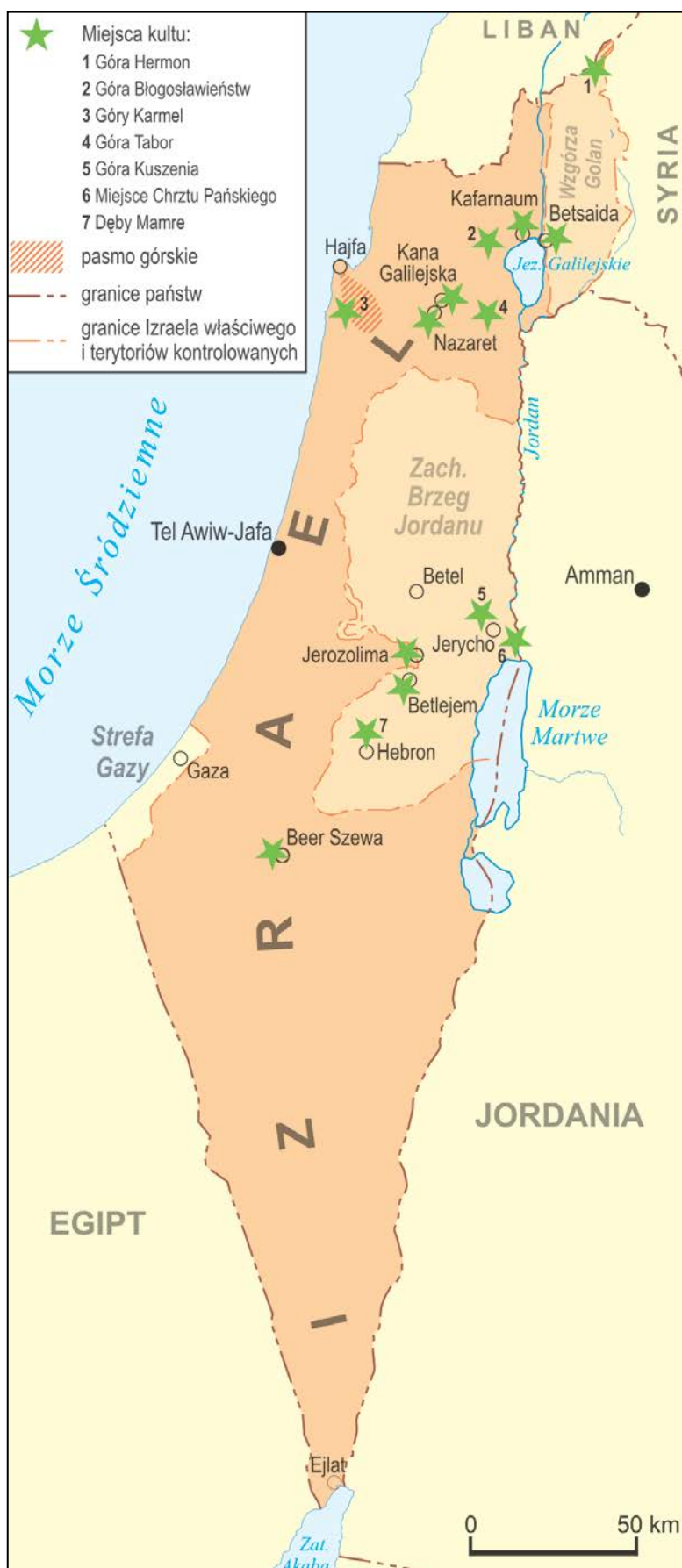
Fig. 1. Examples of places of veneration in the Holy Land.