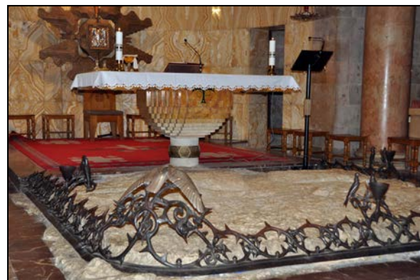
Fot. 11. Kamień, przy którym Chrystus modlił się przed męką w Bazylice Agonii na Górze Oliwnej.

Photo 11. The rock of the Mount of Calvary in the Church of the Holy Sepulcher in Jerusalem.