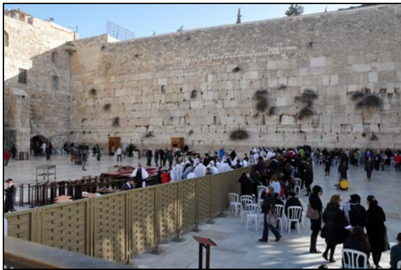
Fot. 9. Żydzi modlący się pod Ścianą Płaczu.

Photo 8. Jewish cemetery in the Valley of Josaphat in Jerusalem.