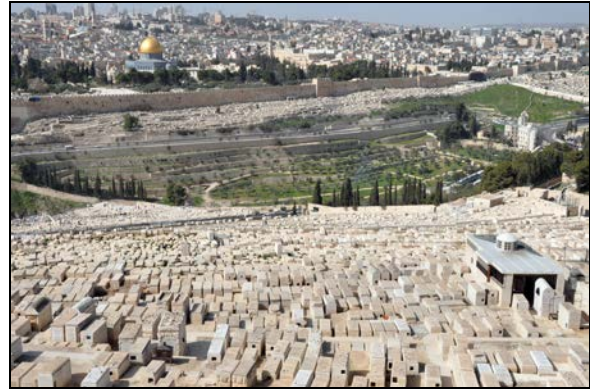
Fot. 8. Cmentarz żydowski w Dolinie Jozafata w Jerozolimie.

Photo 7. Panorama of the Old City in Jerusalem with the Al-Aqsa Mosque.