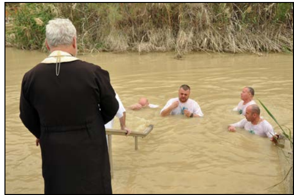
Fot. 1-2. Rzeka Jordan i obrzęd odnowienia przyrzeczeń chrzcielnych w miejscu Chrztu Pańskiego.